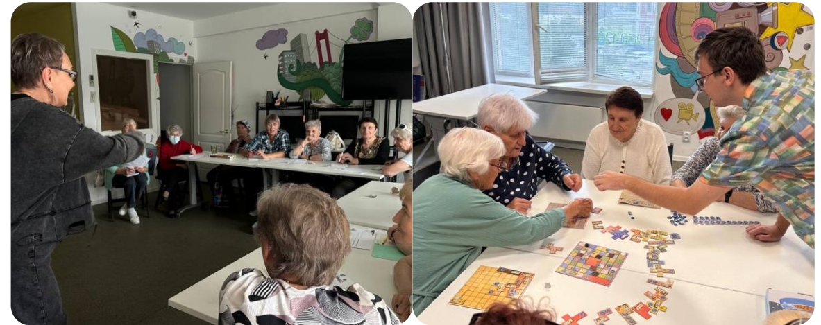
Занятия для участников проекта «Старшие».

Эти люди регулярно обзванивают около 150 пожилых подопечных проекта, поддерживают с ними связь и приглашают на различные мероприятия.