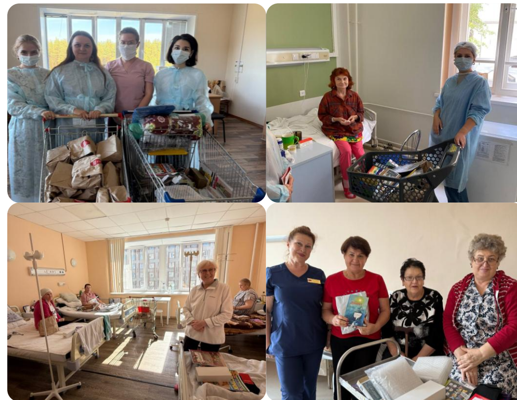
Посещение командой Фонда борьбы с лейкемией пациентов гематологических отделений в Москве, Ярославле и Владимире с акцией «Тележка радости»