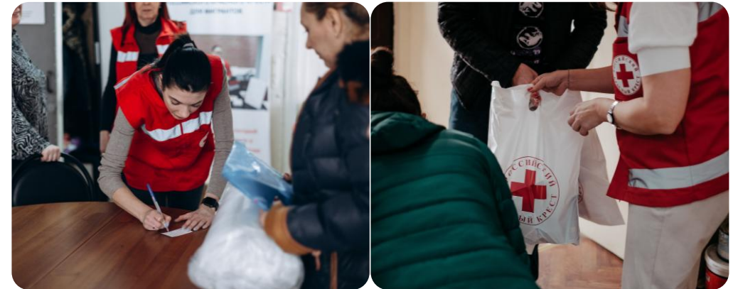
Выдача гуманитарной помощи

На поступившие средства частично оплатили 7 гигиенических и 7 продуктовых наборов для помощи гражданам, прибывшим на территорию Орловской области из приграничных районов Курской и Белгородской областей, разместившимся самостоятельно и обратившимся за помощью в Орловское региональное отделение Красного Креста.