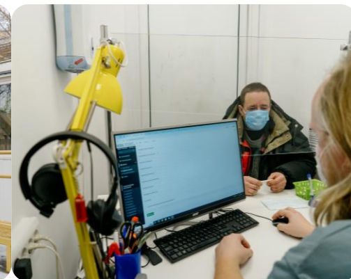
1 — очередь в день приёма в Санкт-Петербурге; 2 — клиент во время консультации с социальным работником